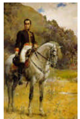
"Retrato ecuestre de Bolívar"

(Tomado del libro LECTURA DE MI TIERRA, de Alejandro Fuenmayor